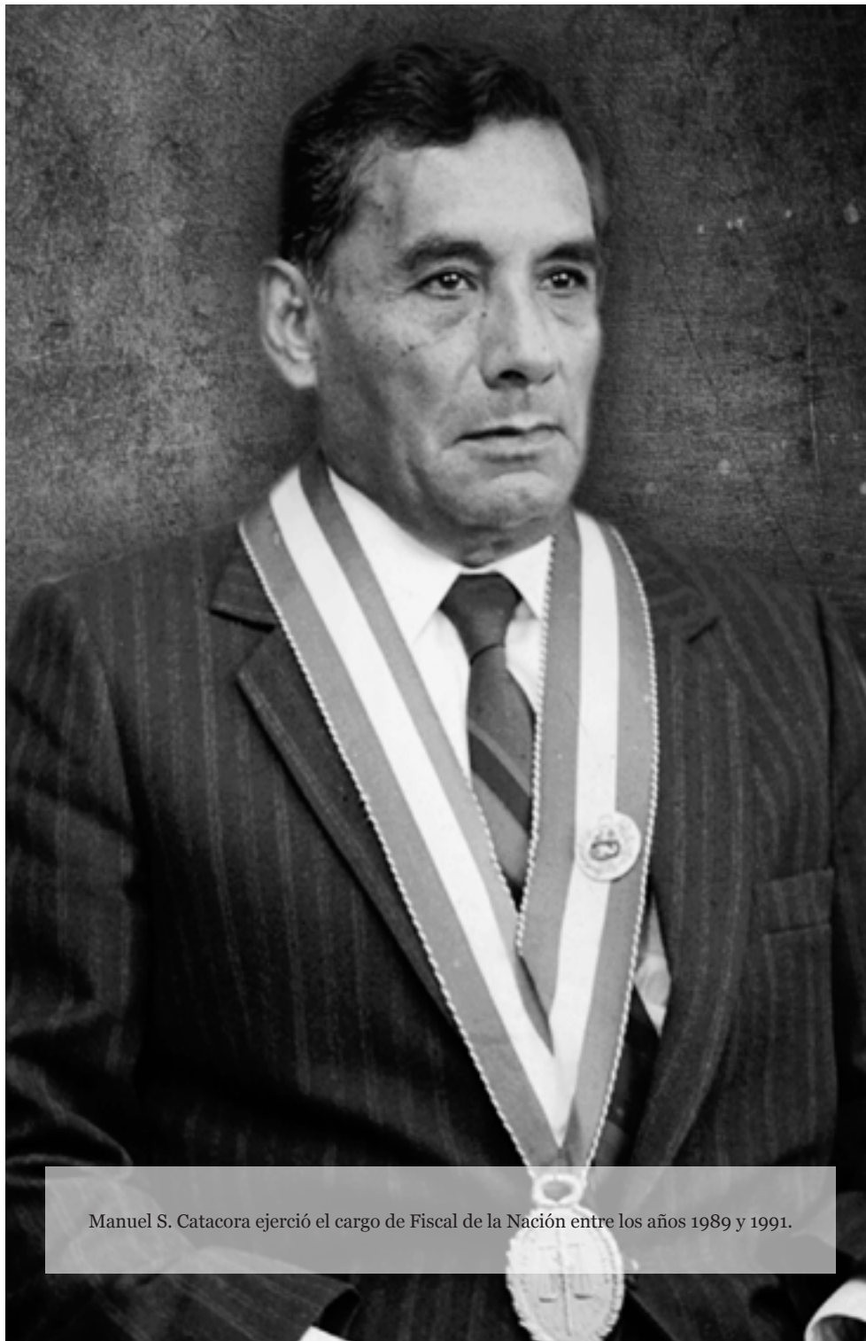
Manuel S. Catacora ejerció el cargo de Fiscal de la Nación entre los años 1989 y 1991.

votar a los Fiscales Supremos Provisionales en decisiones capitales, y con esa imposición era imposible el funcionamiento de una institución. Recuerdo muchas veces que pedíamos vacaciones o licencia para no estar en Juntas donde todo estaba decidido, esto lo hacíamos conjuntamente con Adelaida Bolívar.